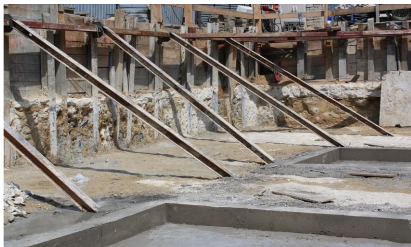
PALISADA Z ROZPORAMI

Wysoki poziom wód gruntowych i niesprzyjająca geologia uniemożliwiła wykonanie prac fundamentowych. Zadanie polegało na wykonaniu ciągłej palisady zabezpieczającej krawędź wykopu od strony ulicy i działek sąsiednich oraz wzmocnieniu posadowienia ściany szczytowej budynku sąsiedniego. Kluczowym celem inwestycji było zabezpieczenie wykopu przed bocznym napływem wód gruntowych i wypłukiwaniem gruntu spod ulicy i budynków sąsiednich. Charakterystyka zlecenia wymagała użycia technologii iniekcji strumieniowej „JET GROUTING” i wykonania kolumn o średnicy Ø800mm. Z racji bezpośredniego sąsiedztwa jezdni, przewidziano w części palisady podparcie jej za pomocą stalowej konstrukcji wsporczej.