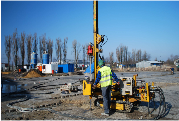
WIERCENIE KOLUMN „JET GROUTING”

Ogółem wykonano 185 szt. kolumn iniekcyjnych „jet grouting” o łącznym obmiarze 1.080,0 mb.