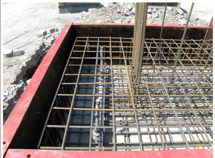
ZBROJENIE STOPY FUNDAMENTOWEJ