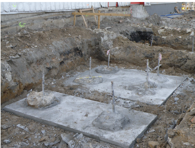
GŁOWICE KOLUMN „JET GROUTING”

W ramach rozbudowy hali magazynowo-biurowej firmy TOPEX zaprojektowano kolumny „jet grouting” \varnothing 800 mm pod realizowanymi fundamentami.