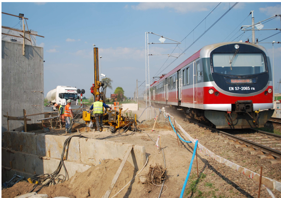
WYKONYWANIE KOLUMN PRZY CZYNNEJ LINII KOLEJOWEJ

Specjalistyczne roboty budowlane polegały na wzmocnieniu posadowienia podpór tymczasowych wiaduktu autostradowego WA-122 w ciągu autostrady A1 w km 133+586.