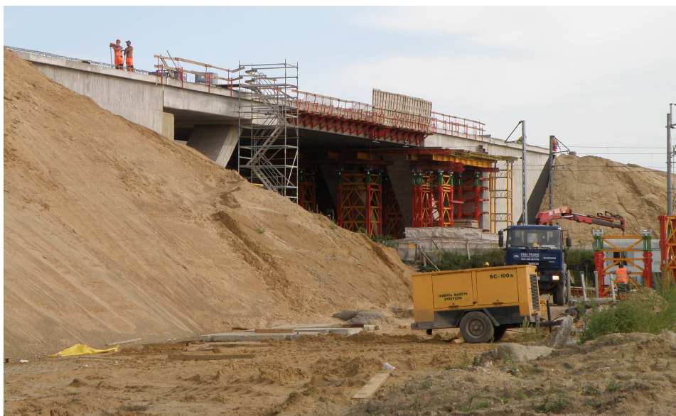
TYMCZASOWE PODPORY USTAWIONE NA WZMOCNIONYM PODŁOŻU

Zakres obejmował wykonanie 52 szt. kolumn iniekcyjnych „jet grouting” ø800 mm o długości 8,0 m. W miejscach, gdzie grunt był znacznie rozluźniony otrzymano kolumny o średnicy do 1000 mm.