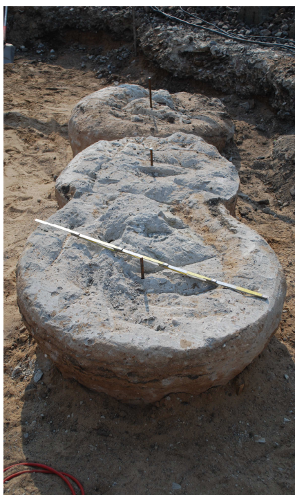
WYKONANE KOLUMNY „JET GROUTING” ø800/1000 mm

Specjalistyczne roboty budowlane polegały na wzmocnieniu posadowienia podpór tymczasowych wiaduktu autostradowego WA-122 w ciągu autostrady A1 w km 133+586.