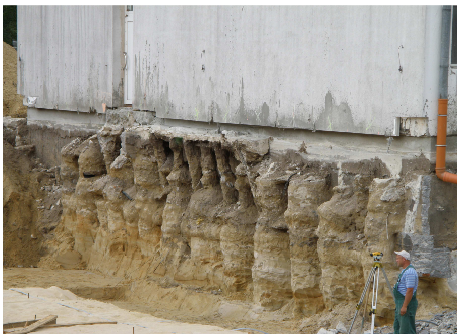
ODKOPANA PALISADA Z KOLUMN INIEKCYJNYCH

Wykonane prace umożliwiły wykonanie wykopu pod pływalnię do żądanej głębokości, unikając tym samym niebezpieczeństwa uszkodzenia istniejącego budynku sali gimnastycznej.