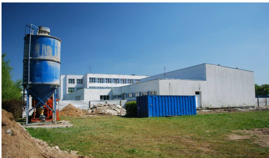
ZAPLECZE BUDOWY PRZY BUDYNKU SALI GIMNASTYCZNEJ

Ze względu na bezpośrednią dobudowę do istniejącego budynku konieczne było wykonanie specjalistycznych prac polegających na podbiciu ściany szczytowej.