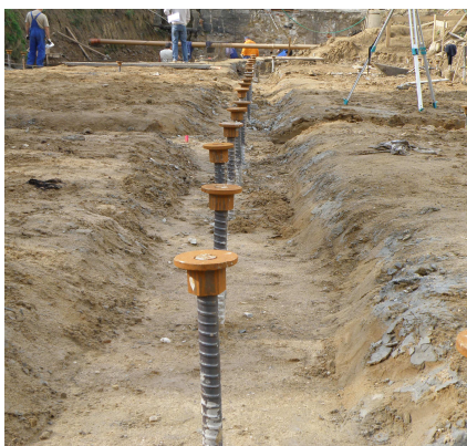
WYKONANE MIKROPALE POD ŁAWĘ FUNDAMENTOWĄ

Specjalistyczne roboty budowlane polegały na wykonaniu mikropali iniekcyjnych w systemie SAS, wzmacniających posadowienie sali gimnastycznej przy Szkole Podstawowej w Gierałtowiec.