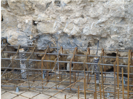
MIKROPALE WYKONANE PRZY ISTNIEJĄCEJ ŚCIANIE